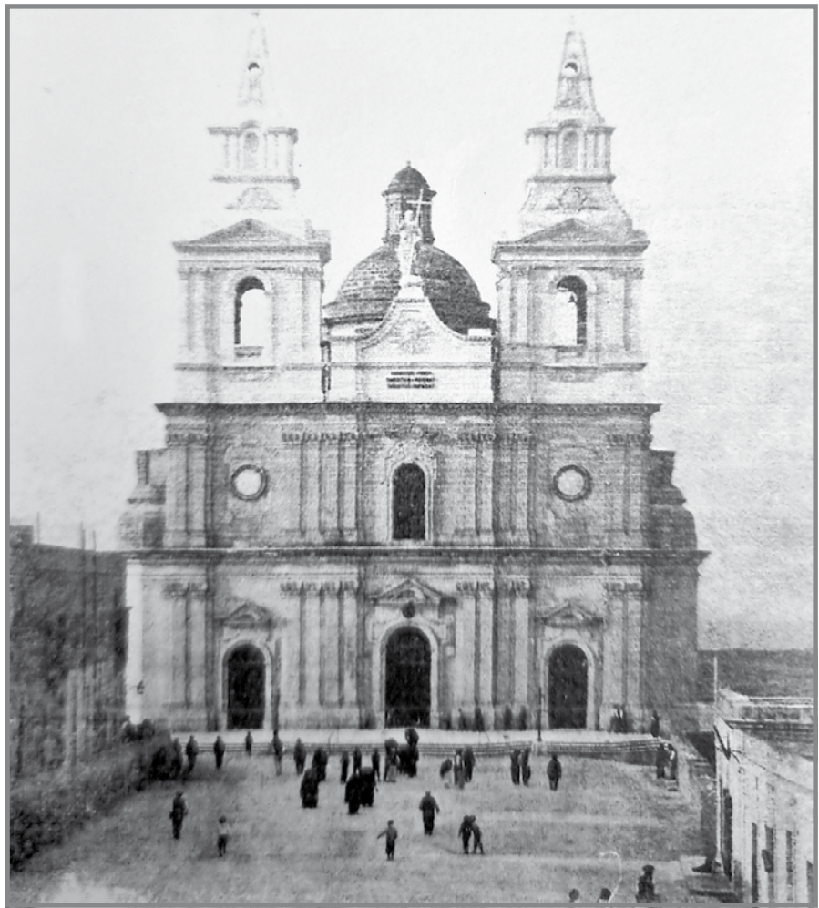
Il-faċċata tal-knisja tal-Mellieħa wara li tlestew il-kampnari.